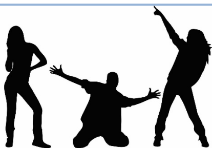
Театральная студия Туран